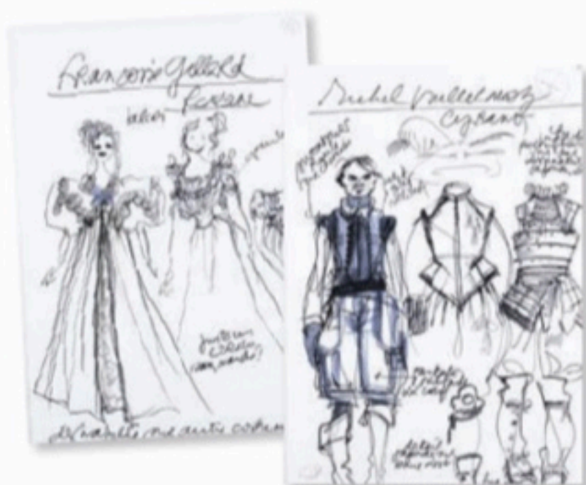
Maquette de costumes de Ch. Lacroix, 2006.