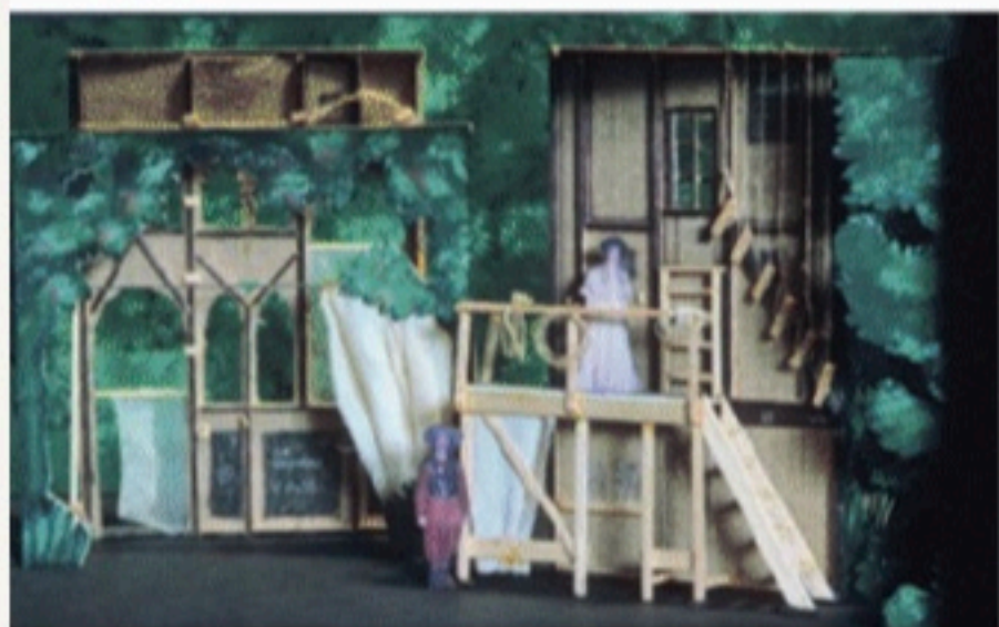
Maquette d'É. Ruf, 2006.